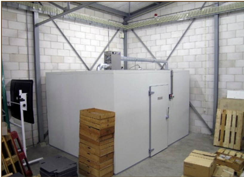
Sinds eind 2006 worden alle metalen voorwerpen in een zeer droge klimaatkamer bewaard.

In november werd in het Groninger gedeelte een kleine klimaatkamer voor de opslag van metalen voorwerpen ingebouwd. Met name ijzer is zeer gevoelig voor corrosie en vraagt een luchtvochtigheid van <30%. Als tussenoplossing werd tot dusver nieuw verwerkt materiaal tijdelijk ondergebracht in de klimaatkamer voor organisch materiaal. In 2007 wordt zoveel mogelijk metaal uit de algemene opslag naar de nieuwe ruimte overgebracht.