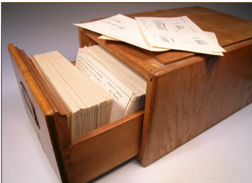
Een bijzonder bezit vormt een kaartenbak met de originele vondscatalogus van hunebed D53, in 1918 door Van Giffen onderzocht.