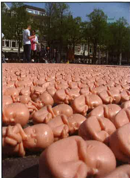
30.000 modelletjes van ongeboren kinderen van 10 weken op het Plein in Den Haag als schreeuw om leven

Dinsdag 1 maart, de dag voor de verkiezingen voor de Provinciale Staten bent u uitgenodigd om van 10.00 tot 12.00 uur te bidden en te waken bij de abortusklinieken in Nederland (zie onderstaand voor de adressen). In de meeste provincies is een abortuskliniek. Elke dag worden er in ons land honderd kinderen gedood. Meer dan 30.000 per jaar. Sinds de aanname van de Wet afbreking zwangerschap op 28 april 1981 in de Eerste Kamer, 30 jaar geleden, maar ook al daarvoor, zijn bijna één miljoen kinderen geaborteerd!