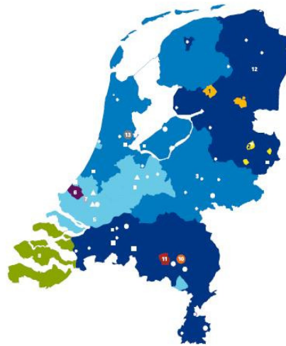
GASNETWERKEN (MIDIO 2007)