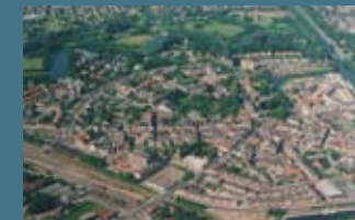
Stervormige structuur centrum Coevorden