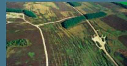
Middeleeuwse karrensporen Balloërveld