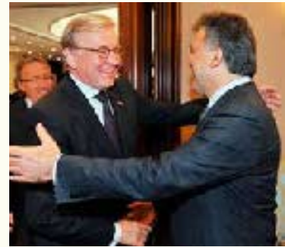
Rechts Bezoek Voorzitter Eerste Kamer aan de President van Turkije dhr. Gül

Op uitnodiging van de Voorzitter van de Turkse Grand National Assembly, de heer Şahin, heeft de Voorzitter van de Eerste Kamer in april 2010 een bezoek gebracht aan Turkije. Met zijn opvolger als Voorzitter van de Parlementaire Assemblée van de Raad van Europa, de Turk de heer Çavuşoğlu, besprak de Senaatsvoorzitter onder meer het belang van parlementaire diplomatie in een snel veranderende wereld en het belang van een sterke afvaardiging van nationale parlementariërs naar internationale parlementaire assemblees. In een gesprek met parlamentsvoorzitter Şahin kwamen behalve Europese en internationale vraagstukken ook de betrekkingen tussen Turkije en Nederland aan de orde. Met name het naderende jubileum van 400 jaar diplomatieke betrekkingen tussen Turkije en Nederland in 2012 kreeg aandacht. Met President Gül besprak de Kamervoorzitter de voortgang in de onderhandelingen over de toetreding van Turkije tot de Europese Unie, de verhouding van Turkije tot de landen in de regio (waaronder Rusland, Georgië, Armenië, Irak, Iran en Syrië), de betrekkingen tussen Turkije en Nederland en de grondwetswijziging die in Turkije op dat moment in behandeling was. De Senaatsvoorzitter merkte op dat een succesvolle afronding van het hervormingsproces een voorwaarde is voor de toetreding van Turkije tot de Europese Unie. Bijzondere aandacht is in de gesprekken ook besteed aan de positie van de vrouw in Turkije.