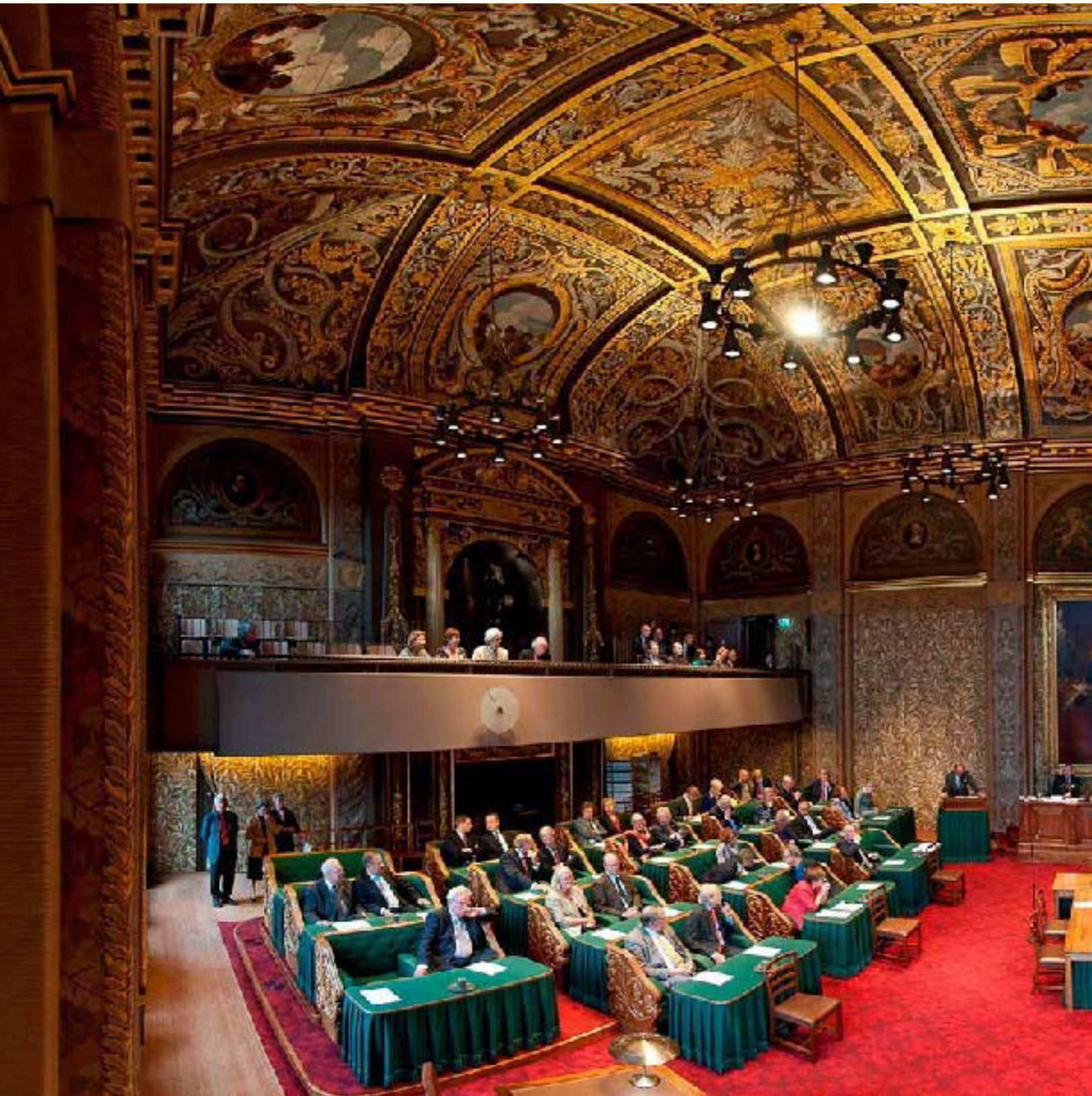
De Eerste Kamer