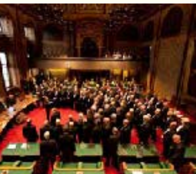
Optreden Koninklijke Zangvereniging Mastrechtster Staar bij bezoek Provincie Limburg

deling van het wetsvoorstel - liet de Staatssecretaris van Binnenlandse Zaken en Koninkrijksrelaties weten dat het kabinet de reactie op het Rob-advies aan zijn opvolger overlaat, waardoor de presentatie van dit standpunt enige vertraging oploopt. 118