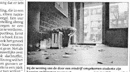
Bij de woning van de door een misdrijf omgekomen studente zijn kassies en bloemen neergezet.

Wij maken de zekerheid af op www.vos.nl of op de telefoonlijn 0900-123456789. TOYOYA