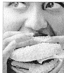
Een meisje geniet van haar hamburger.