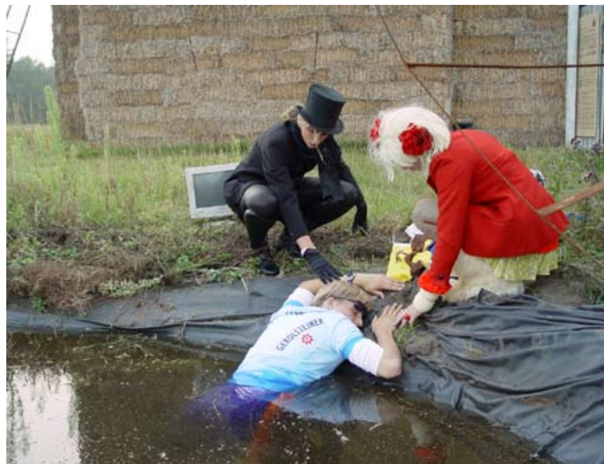
Jong talent in kweekvijver....