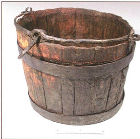
Houten emmer, vermoedelijk 17-18e eeuws, gevonden in een meander van de Hunze nabij Spijkerboor, door G. ter Maat. De emmer is gerestaureerd door G. van Oortmersen (R.U. Groningen)

Een aanhoudend probleem in het depot betreft het gebrek aan ruimte. Zoals eerder is aangegeven, dekt de benaming "archeologisch depot" de lading voor ongeveer 60%. Alle 3 provinciale musea gebruiken iedere meter open ruimte voor andersoortige opslag, op grond van een vroeger gemaakte informele afspraak. De musea erkennen dat ze de archeologische opslag in de weg zitten, waarbij als positief punt opgemerkt kan worden dat de musea uit Leeuwarden en Groningen incidenteel probeerden ruimte te scheppen. Bij overleg met het Drents Museum, dat de opslag in 2005 juist inten-