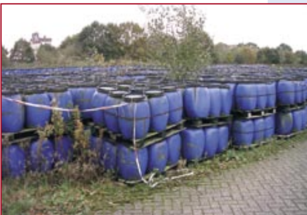
Opslagterrein EMMTEC in Emmen.

De nieuwe Wet op de kwaliteitszorg rampenbeheersing vraagt van de provincie jaarlijks een bestuurlijke rapportage aan de minister van BZK. Die samenloop heeft ertoe geleid dat in 2004 een inspectieprotocol is overeengekomen tussen provincies en de Inspectie Openbare Orde en Veiligheid van het Ministerie van BZK. Zo wordt dubbel werk voorkomen en wederzijds gebruik van informatie gestimuleerd.