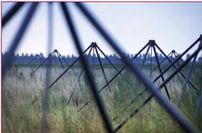
LOFAR-antennes bij Exloo.