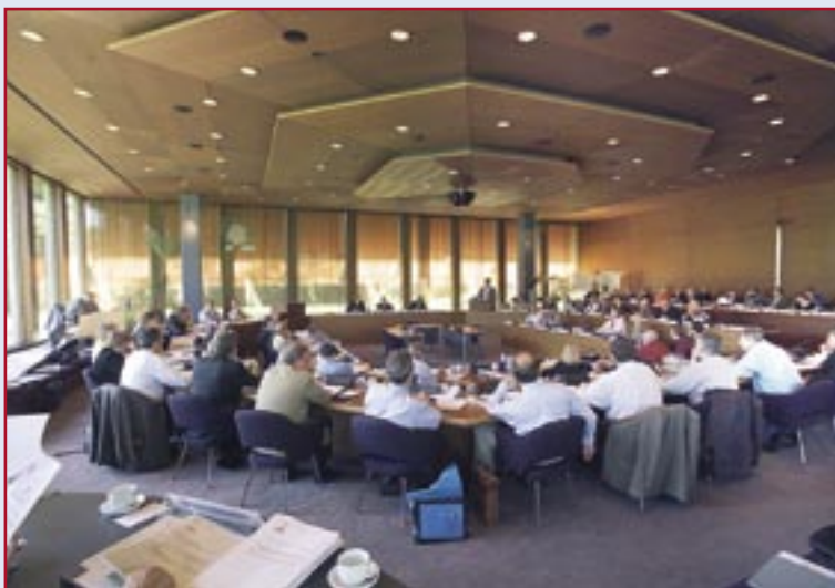
Provinciale staten in vergadering

Over de rol van PS kan ik het volgende zeggen. De controlerende functie is van groot belang. De staten hebben hierbij wezenlijke rechten, zoals het budgetrecht, het initiatiefrecht en het vragenrecht. Een tweede rol is die van volksvertegenwoordiger, gekozen bestuurders als het zijn. De derde rol is in feite nieuw. Dat is de kaderstellende functie van PS. Hierbij heeft men een soort vergelijking willen maken met de verhoudingen op landsniveau, die tussen de regering en de kamer. De kamer is immers controlerend en wetgevend. Daar gaat de vergelijking meteen mank, want in gemeenteraden en in statenvergaderingen wordt niet veel aan wetgeving gedaan. Wat moet je in dit verband dan precies met het begrip kaderstellend aan? Ik stel vast dat iedereen in deze fase van het proces van dualisering zijn rol nog moet vinden. Ik constateer daarbij tegelijkertijd dat er sprake is van meer papier, meer overleg, meer vergaderingen en meer kosten. Dat zijn op zich geen positieve bijverschijnselen.