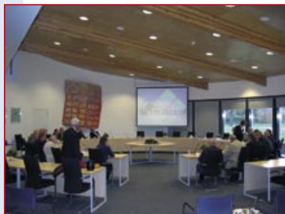
De CvdK brengt een werkbezoek aan de gemeente Aa en Hunze.