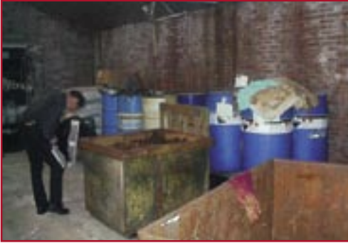
Provinciale inspectie van een opslagplaats voor gevaarlijk afval.