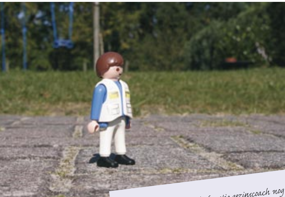
Terugblik van medewerker Zorgzaak op samenwerking met gezinscoach Hoogeveen in een gezin

Zoals ik heb begrepen is de functie gezinscoach nog in een experimentele fase. In het gezin waar wij samenwerken, vind ik de rol van gezinscoach heel waardevol. Om de functie goed te beoordelen heb ik 4 "kopjes" gemaakt.