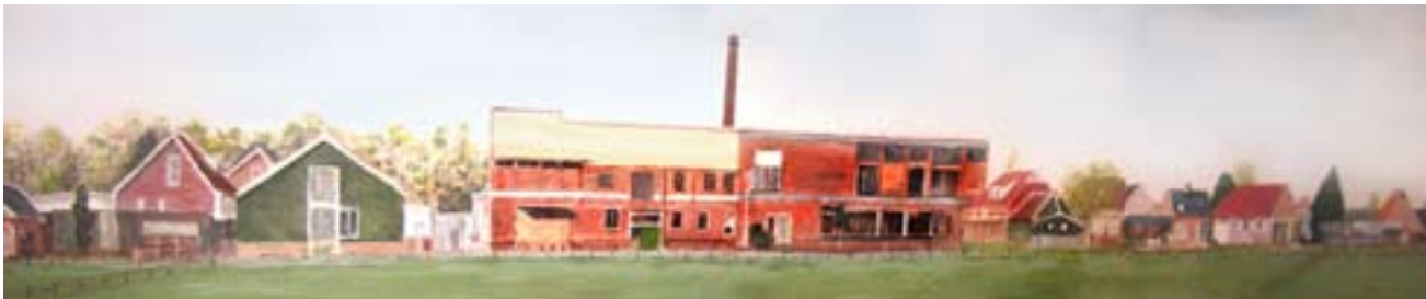
Dorpsgezicht van Wapse, geschilderd op scheidingswand

Er komen echter nog twee jaren. Er is veel gedaan en er staat nog veel meer te gebeuren. We laten ons inspireren door de successen tot nu toe en als er ergens in een dorp nog extra handen nodig zijn voor wat metselwerk, dan sta ik voor u klaar!