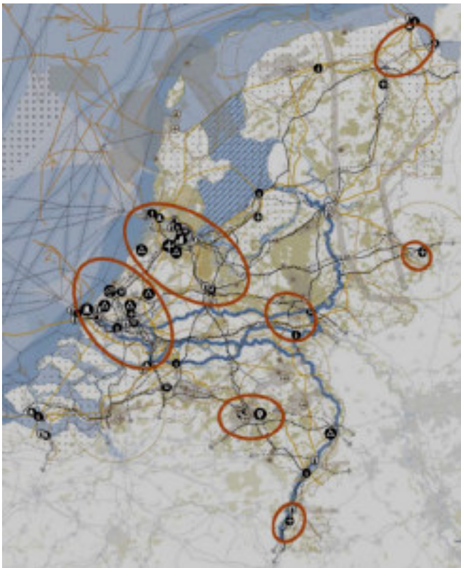
Figuur 1. Stedelijke regio met concentratie van topsectoren.

Het Rijk schetst in de op 13 maart 2012 vastgestelde Structuurvisie Infrastructuur en Ruimte (SVIR) een toekomstperspectief met een overheveling van taken en verantwoordelijkheden op het gebied van de ruimtelijke ordening naar provincies (regierol) en gemeenten (uitvoering). Voor Noord-Nederland ziet het rijk in de SVIR het gebied Groningen-Eemsdelta als 'Stedelijke regio met concentratie van topsectoren'.