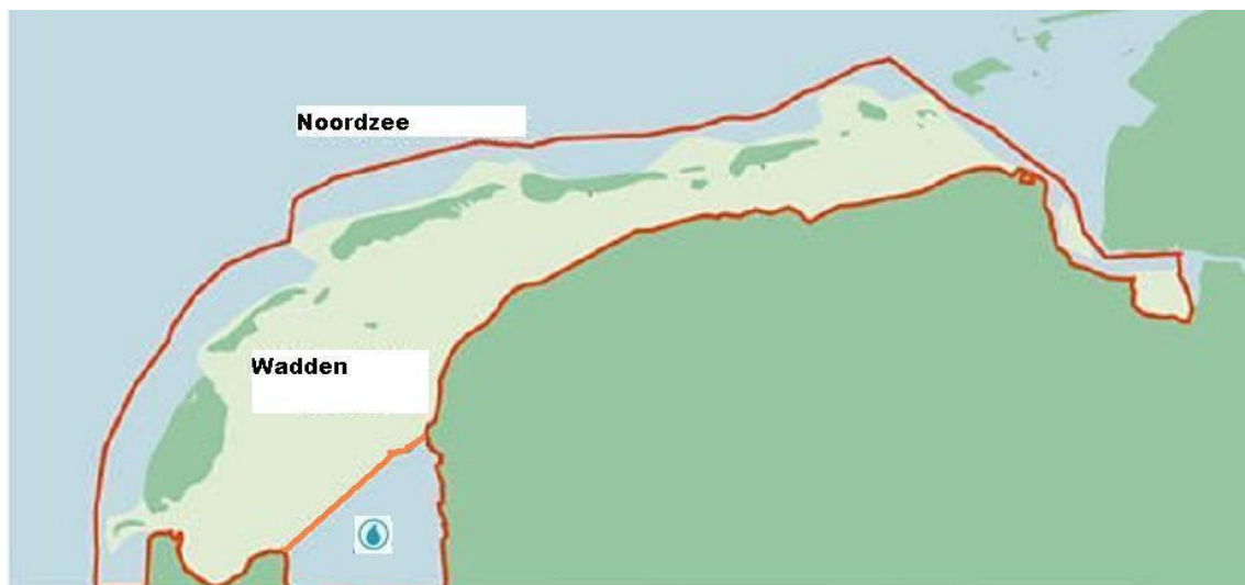
Figuur 2. De nieuwe gemeente Wadden (werktitel)

Een bijzonder gebied in Noord-Nederland is het Waddengebied. De vier Waddengemeenten Vlieland, Terschelling, Ameland en Schiermonnikoog hebben onlangs een samenwerkingsovereenkomst getekend (de VAST-gemeenten), waarbij Texel vooralsnog een adviserende rol vervult. Vanuit het gebied als Werelderfgoed, een effectieve rampenbestrijding en een eenduidige aansturing van het beheer van het Natura 2000-gebied Waddenzee valt er veel voor te zeggen dit gebied als één nieuw Waddengemeente aan te wijzen. Dit vraagt vanwege de benodigde provinciegrenscorrectie wel de nodige medewerking van de nieuwe provincie Randstad-Noord. Tegelijkertijd dient het beheer van het Natura 2000-gebied IJsselmeer aan de nieuwe provincie Randstad-Noord te worden overgedragen. Ook hiervoor is een provinciegrenscorrectie nodig. Het Gemeentefonds zal voor deze nieuwe gemeente moeten worden aangepast om de voor dit gebied specifieke taken uit te kunnen voeren.