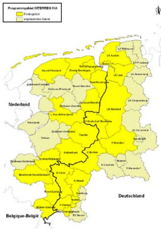
Figuur 2: Het programmagebied INTERREG IV A NL-D

Het SNN zal met de Duitse bestuurders initiatieven nemen om de betrokkenheid van de marktsector en de kennisinstellingen bij het INTERREG A programma te versterken