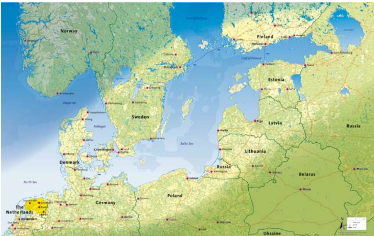
Figuur 1: Het perspectief van Noord-Nederland op Noordoost-Europa (bron: NOA project)

In dit hoofdstuk wordt beschreven hoe het SNN met behulp van de verschillende instrumenten die ter beschikking staan, zijn positie in Noordoost-Europa met behulp van zijn internationale partners kan versterken.