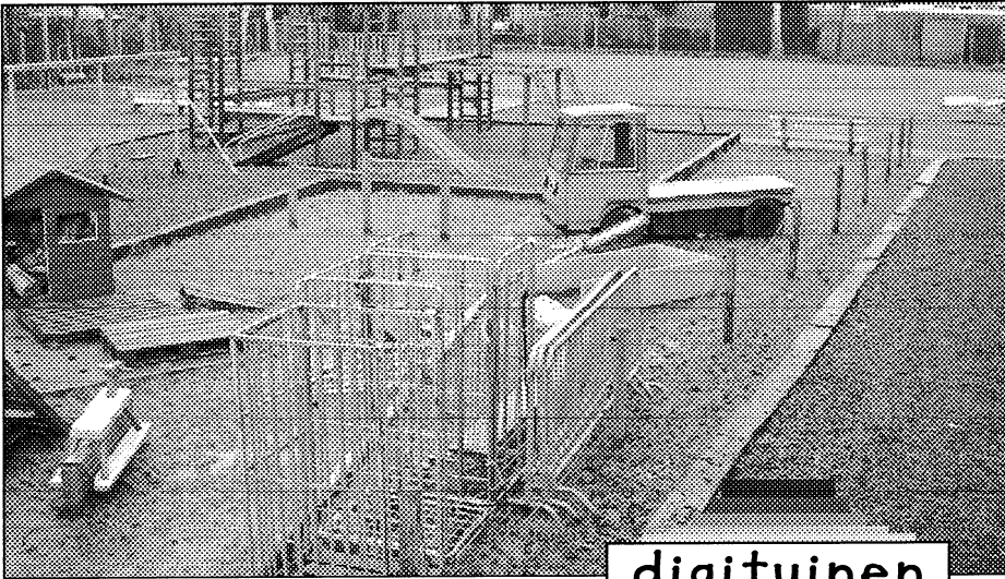
Speeltuin tijdens de renovatie.