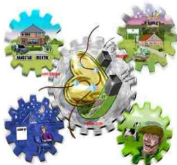
Drenthe: het gouden hart van Nederland