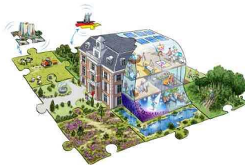
Het landgoed Drenthe