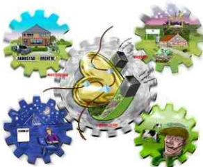
Drenthe: het gouden hart van Nederland