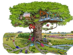
Drenthe als trotse boom

De belangrijkste kenmerken (welke één op één zijn over genomen van de betreffende beelden) in het kort: