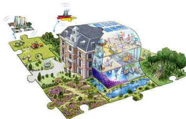
Het landgoed Drenthe