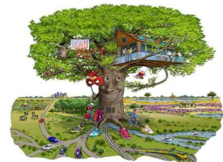
Drenthe als trotse boom