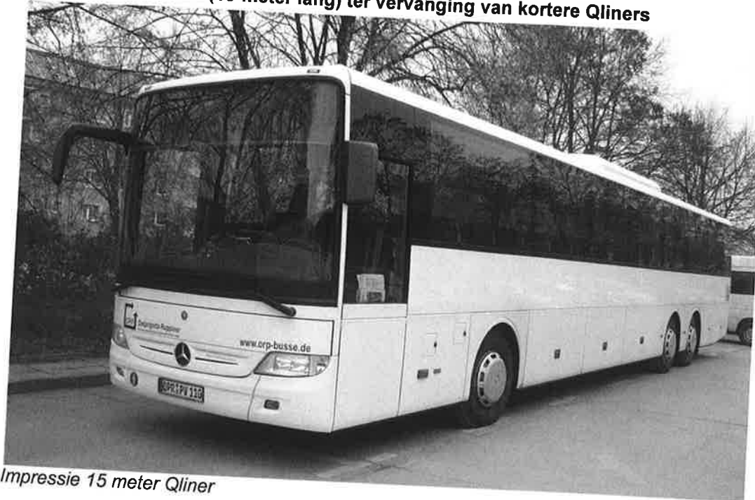
Impressie 15 meter Qliner