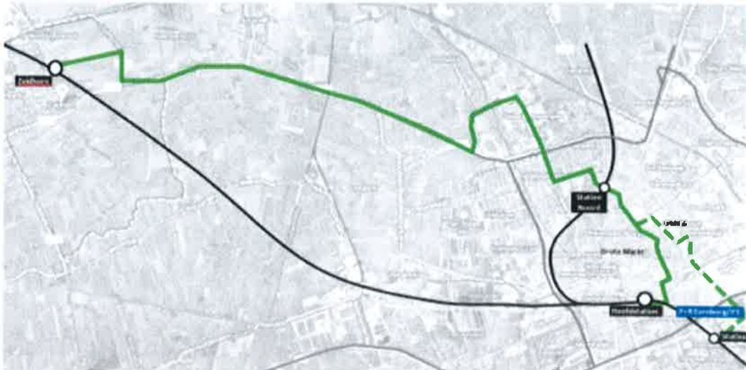
Inzet Hess-bussen op lijn 11