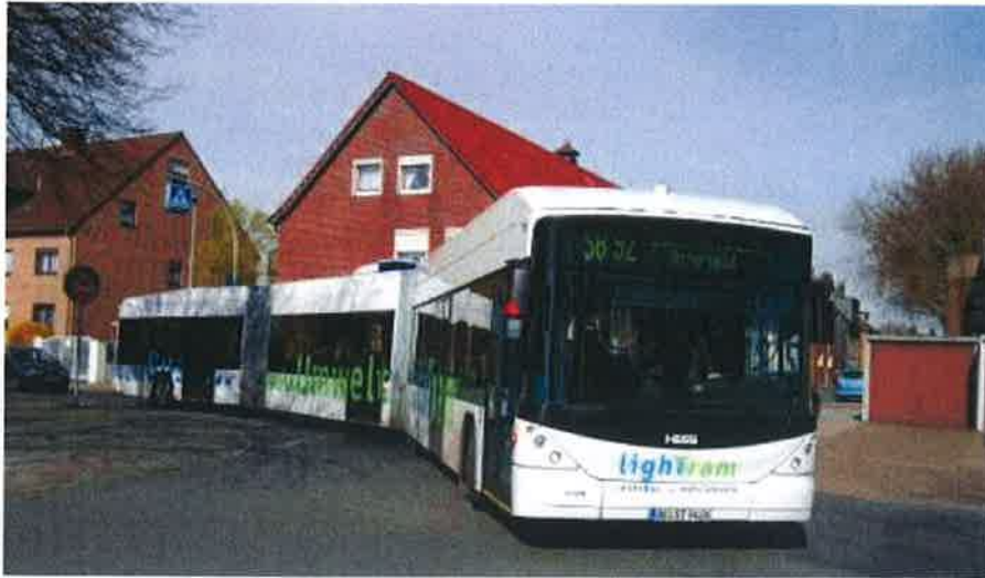
Impressie Hess 24-meter hybridebus