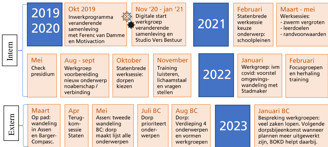
Figuur 1 Tijdlijn Drenthe aan zet

In Assen zijn Statenleden twee keer de straat op gegaan voor verkennende gesprekken. Vanuit de gesprekken ontstond er geen nader initiatief. De inwoners gaven veelal aan heel tevreden te zijn; ze maakten gebruik van voorzieningen in de wijk of elders in de stad en wisten hun weg daarin te vinden. Leerpunt hieruit is dat in een stad wellicht een andere aanpak nodig is dan in een dorp. De groep die naar Hollandscheveld zou gaan kon door ziekte en agenda-technische redenen uiteindelijk niet gaan. Leerpunt hieruit is om in zo groot mogelijke groep/ als collectief op pad te gaan.