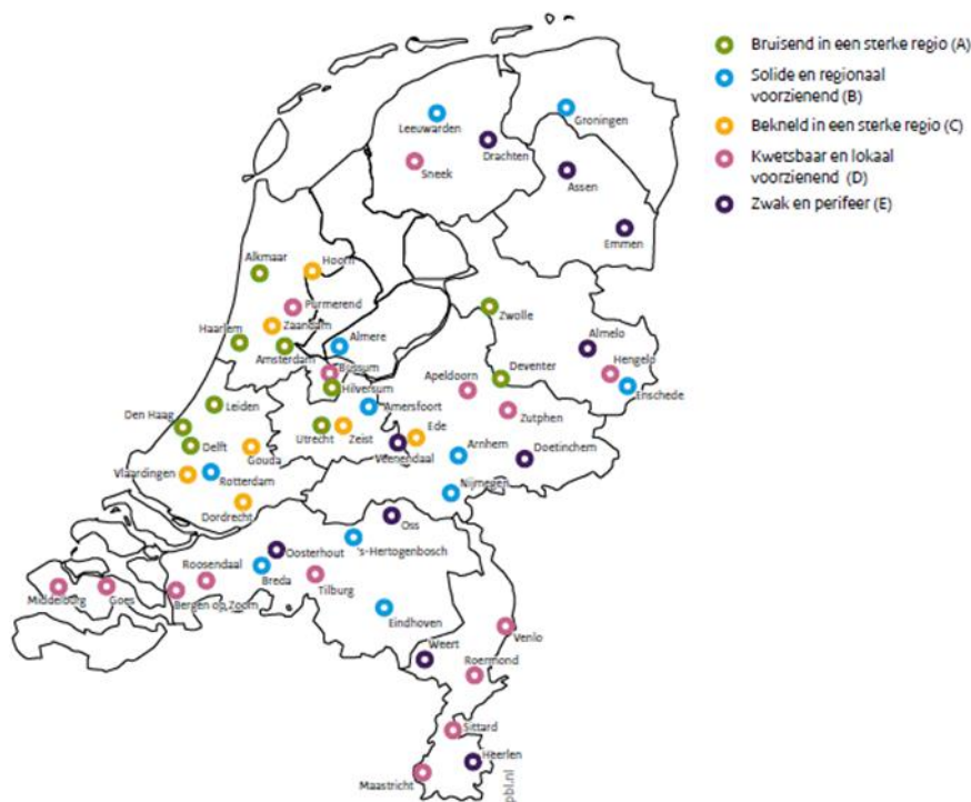
Figuur 2: Winkelsteden in Nederland

In de meest recente sociale staat van het platteland, wordt Drenthe gekenschetst als een provincie met een aantal kleinere stedelijke centra die in eerste instantie een rol hebben voor het omliggende platteland. 3 Dit is ook het beeld wat naar voren komt in de Quicksan van Onderzoek en Statistiek. Dit tekent de regio waarbij vooral de woonfunctie, de natuur en de recreatie onderscheidende kenmerken zijn van andere regio's . Het benadrukt ook het belang van het omliggende gebied voor de stad, als verzorgingsgebied en als woongebied. Steden hebben het achterland nodig voor specifieke producten en diensten die in de stad niet te verkrijgen zijn (rust, ruimte en groen), maar ook landbouw.