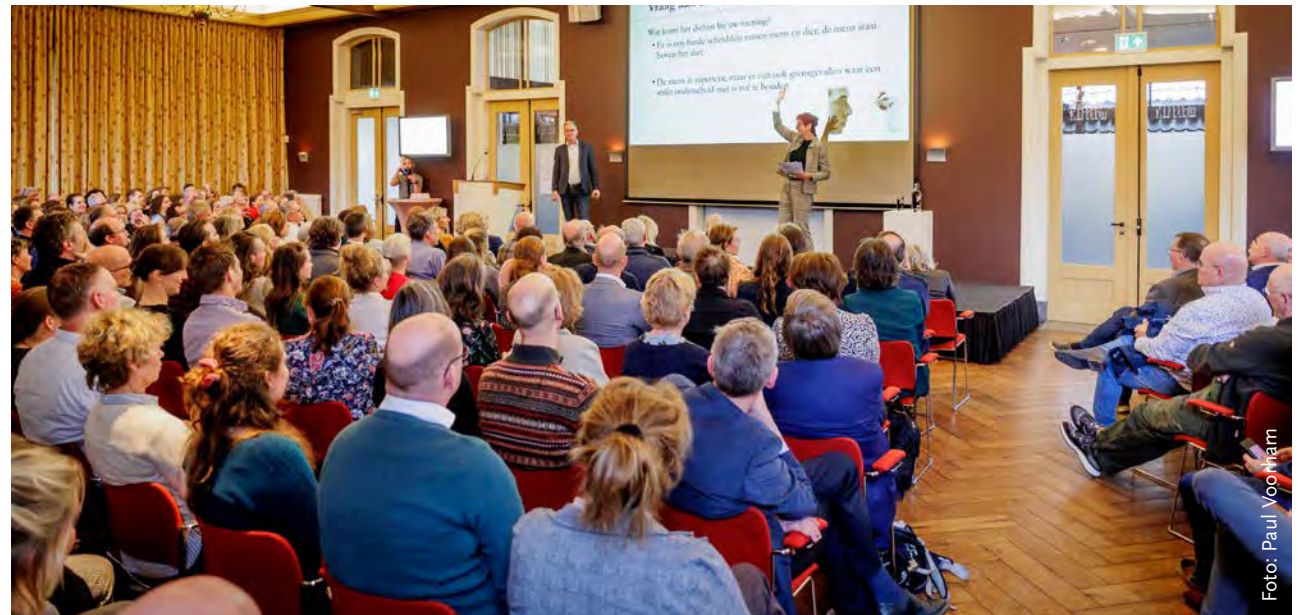
Tijdens het congres in april werden de resultaten van het publieksonderzoek gepresenteerd.

De zienswijze en de publiekssamenvatting zijn te vinden op de website van de RDA.