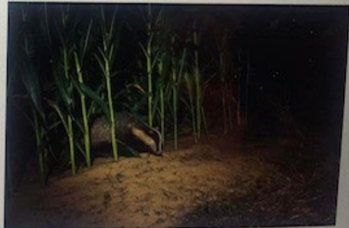
Schade aan een maisveld door een das

De nieuwe overeenkomsten gaan per 1 november 2023 in. Voor agrariërs kan dit betekenen dat men met een andere organisatie in contact komt dan voorheen. De overeenkomsten met de nieuwe taxatiebureaus zijn tot stand gekomen na een Europese aanbesteding begin 2023. De huidige taxatiebureaus Wiberg Taxaties en Van Ameyde Waarderingen blijven een deel van de faunaschade voor BIJ12 taxeren. Wie welke faunaschade gaat taxeren is hieronder te zien: