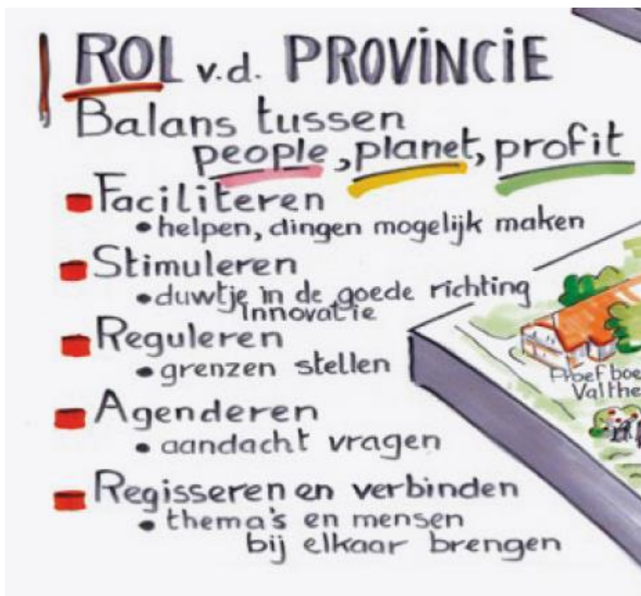
Figuur 1: verschillende rollen die de provincie voor zichzelf ziet