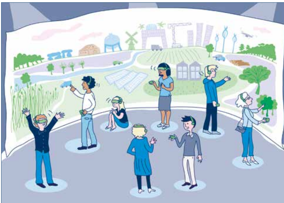
Tentoonstelling van de toekomstbeelden