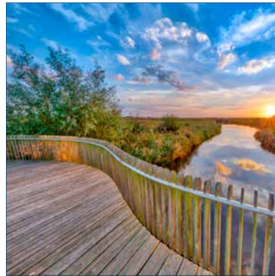
Afwentelen voorkomen (waterberging Onlanden)