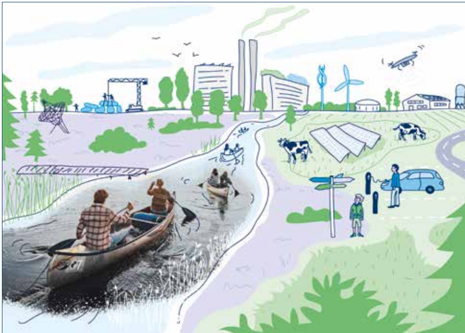
Toekomstgesprekken aan de hand van excursies

De toekomstgesprekken worden vertaald naar toekomstbeelden, waarbij de vraag wordt gesteld hoe die toekomst gerealiseerd kan worden en welke keuzes daarvoor nodig zijn. De toekomstbeelden maken duidelijk waar de gesprekpartners het over eens zijn, waarover de meningen verschillen en hoe zich dat kan uiten in het landschap. De verschillende toekomstbeelden voor de verschillende gebieden geven een blik op de gewenste ontwikkeling van Drenthe. Dit totaalbeeld kan een ronde door Drenthe maken, om daarmee een breder publiek te betrekken.