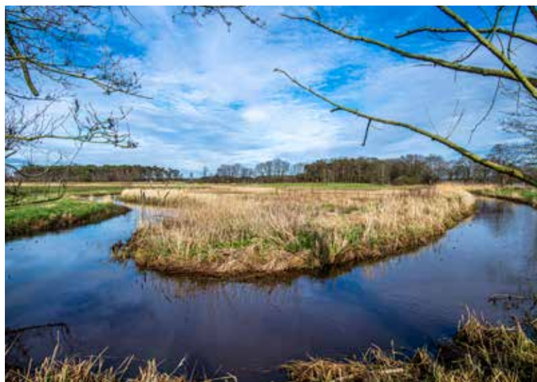
Water sturend in het huidige beleid: "geen kapitaalintensieve ontwikkelingen in de beekdalen".

Het kabinet wil bij de inrichting van Nederland meer rekening houden met water en bodem. Daarvoor zijn diverse structurerende keuzes gemaakt. Veel van deze keuzes zijn randvoorwaarden die we mee moeten nemen naar het gebiedsprogramma PPLG of in het ruimtelijk arrangement.