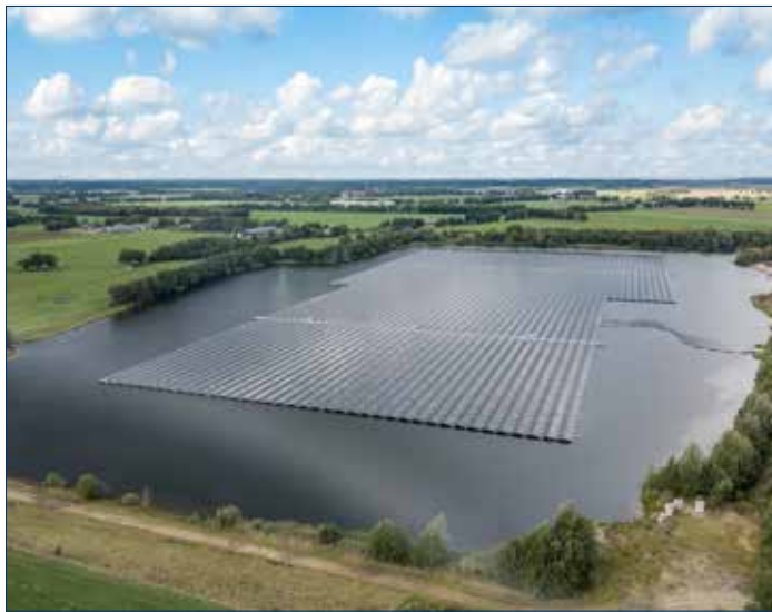
Combineren van functies (zandafgraving en zonnepark De Mussels)