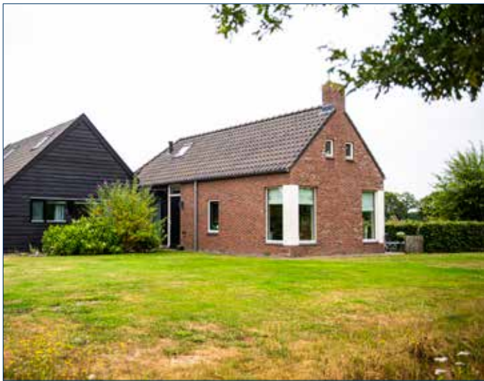
Kenmerken en identiteit (koloniewoningen Frederiksoord)