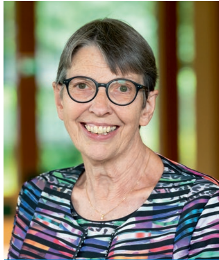
Jetta Klijnsma (commissaris van de Koning)